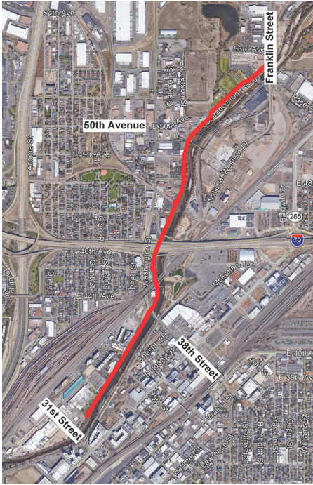
Vista aérea del área del proyecto entre la calle 31 oeste y la calle Franklin norte

La Ciudad y Condado de Denver y la organización para gestión de inundaciones Mile High Flood District avanzan el diseño técnico y proyecto de construcción para mejorar el dique y el sistema de control de inundaciones existentes a lo largo de la ribera oeste del río South Platte llamado Mejoras al Dique de Globeville . Las mejoras al dique de Globeville se extenderán desde la calle 31 oeste hasta la calle Franklin norte.